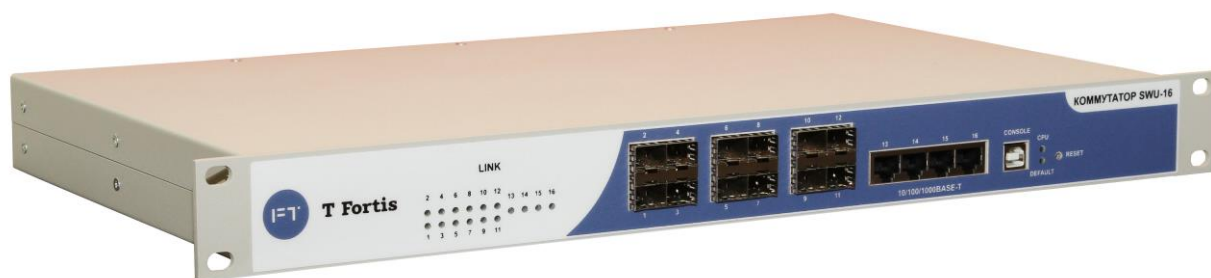
Рис. 2.1. Внешний вид